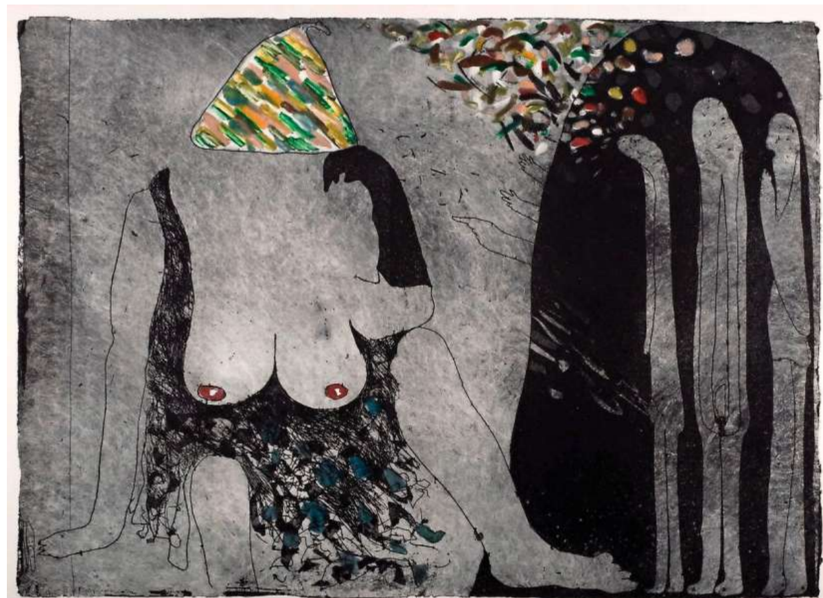
'Loving You' (1985)

Al een halve eeuw bezig met diverse kunstvormen