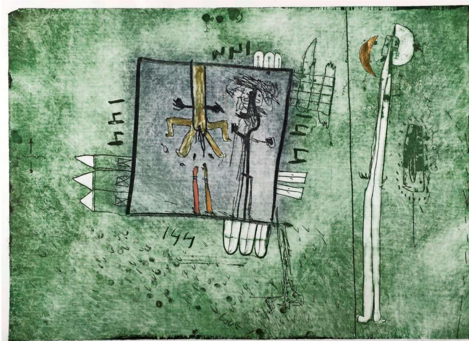
'Honderd vier en veertig' (1987)